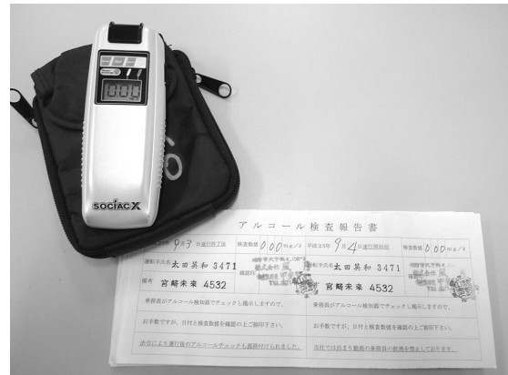
携帯型アルコールチェッカーと確認証

宿泊先においてもチェックイン時及びチェックアウト時に携帯式のアルコールチェッカーにて、宿泊先の協力のもと、第三者立会いのアルコールチェックを実施しています。(ホテル・旅館のフロントスタッフに確認印を押印していただいています。)